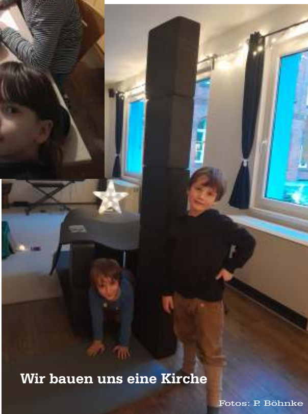
Wir bauen uns eine Kirche