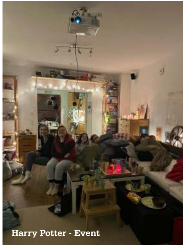
Harry Potter - Event