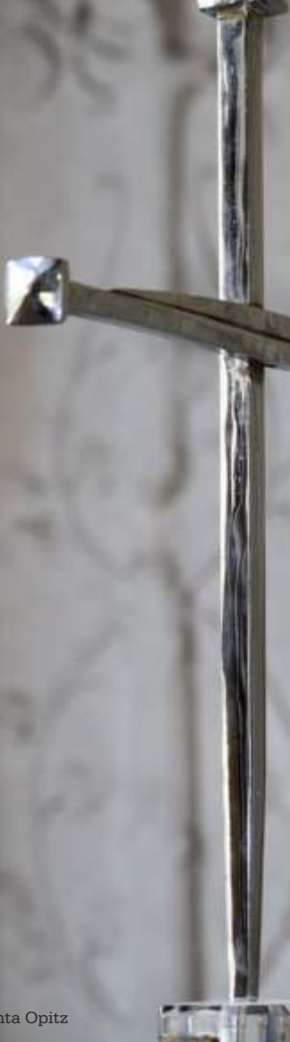
Nagelkreuz in der Kaiser-Wilhelm-Gedächtniskirche Berlin

Alle haben gesündigt und ermangeln des Ruhmes, den sie bei Gott haben sollten. Den Hass, der Nation von Nation trennt, Volk von Volk, Klasse von Klasse, Vater, vergib. Das Streben der Menschen und Völker zu besitzen, was nicht ihr Eigen ist, Vater, vergib. Die Besitzgier, die die Arbeit der Menschen ausnutzt und die Erde verwüstet, Vater, vergib. Unseren Neid auf das Wohlergehen und Glück der Anderen, Vater, vergib. Unsere mangelnde Teilnahme an der Not der Gefangenen, Heimatlosen und Flüchtlinge, Vater, vergib. Die Gier, die Frauen, Männer und Kinder entwürdigt und an Leib und Seele missbraucht, Vater, vergib. Den Hochmut, der uns verleitet, auf uns selbst zu vertrauen und nicht auf Gott, Vater, vergib. Seid untereinander freundlich, herzlich und vergebet einer dem anderen, wie Gott euch vergeben hat in Jesus Christus.